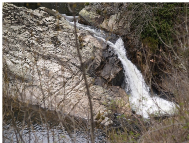
O Bibei en Pradorramisquedo

Rego de Porto Ferrado. Paradela (Viana do Bolo). Vese a carón da estrada ao cruzar o río.